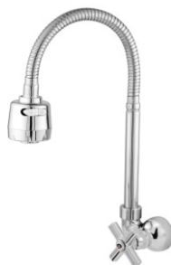
2063 Torneira Gourmet Bica Móvel Parede Luxo