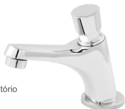
1194 Torneira p/ Lavatório Automática