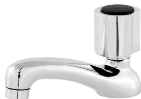
1196 Torneira p/ Lavatório Luxo