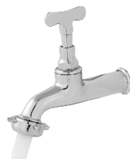
1130 Torneira Cromada p/ Jardim c/ Bico 1/2 - 3/4