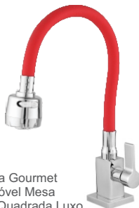
3168 Torneira Gourmet Bica Móvel Mesa Color Quadrada Luxo