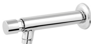
1025 Torneira Pia Automática Parede