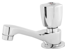
1194 Torneira p/ Lavatório Luxo