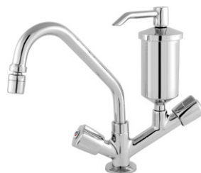
2168 Torneira Bica Móvel de Mesa c/ Filtro ABS ou Metal