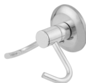
Cabide Duplo Light