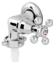
1427 Registro p/ Máquina de Lavar