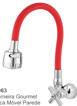
2063 Torneira Gourmet Bica Móvel Parede Color Luxo