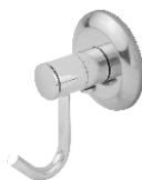
Cabide Simples Light