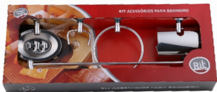
Kit Banheiro 05 peças - Standard