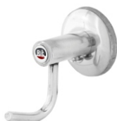
16008 Cabide Simples