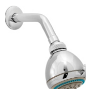
1814 Chuveiro Articulado ABS 3 Funções