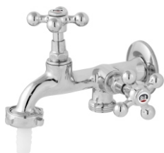
1428 Torneira p/ Máquina de Lavar - 1/2 - 3/4