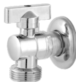
Registro p/ Máquina de Lavar