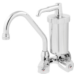
2167 Torneira Bica Móvel de Parede c/ Filtro ABS ou Metal 1/2 ou 3/4