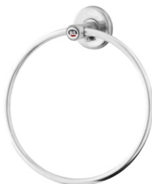
16002 Porta Toalha Argola