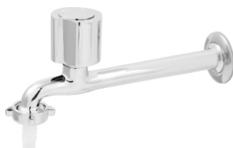
1159 Torneira p/ Pia Cozinha c/ Bico 1/2 - 3/4 - 22cm