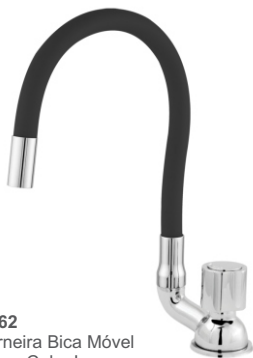
2062 Torneira Bica Móvel Mesa Color Luxo