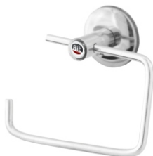
16006 Papeleira Simples