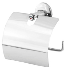
16005 Papeleira c/ Tampa