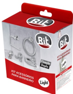
Kit Banheiro 05 peças - Light