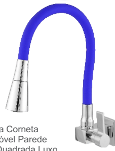
3167 Torneira Corneta Bica Móvel Parede Color Quadrada Luxo