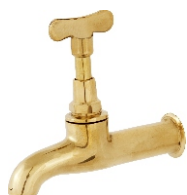
1126 Torneira Amarela p/ Tanque 1/2 - 3/4