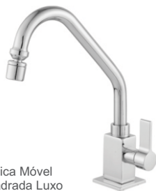
3168 Torneira Bica Móvel Mesa Quadrada Luxo