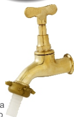
1128 Torneira Amarela p/ Jardim c/ Bico 1/2 - 3/4