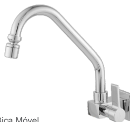
3167 Torneira Bica Móvel Parede Quadrada Luxo