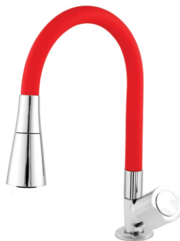
1168 Torneira Color Corneta Bica Móvel Bancada 1/4 de Volta