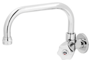
1167 Torneira Bica Móvel Cano Baixo de Parede 1/2 - 3/4