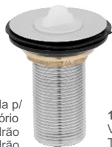
1605 Válvula para Tanque