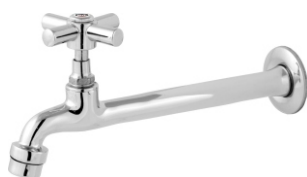
1159 Torneira p/ Pia Cozinha c/ Arejador 1/2 - 3/4 - 22cm