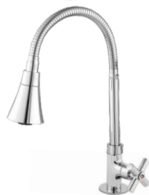
2199 Torneira Cônico Bica Móvel Mesa Luxo