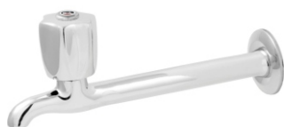
1159 Torneira p/ Pia Cozinha 1/2 - 3/4 - 22cm