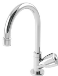
2197 Torneira p/ Lavatório Luxo