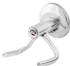
16007 Cabide Duplo