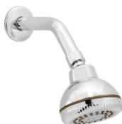
1813 Chuveiro Articulado ABS Básico