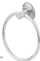
Porta Toalha Rosto Light