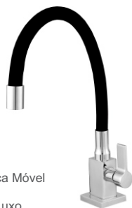
3168 Torneira Bica Móvel Mesa Color Quadrada Luxo