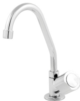
1168 Torneira Bica Móvel Cano Alto de Mesa