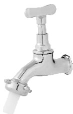
1128 Torneira Cromada p/ Jardim c/ Bico 1/2 - 3/4