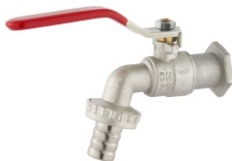
1100 Torneira Esfera 1/2 - 3/4