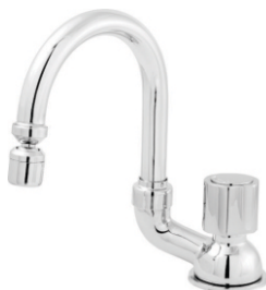
2166 Torneira p/ Lavatório Luxo