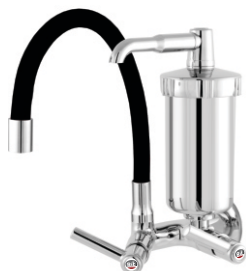
2167 Torneira Bica Móvel de Parede Color c/ Filtro ABS ou Metal