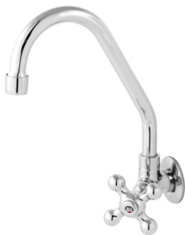
1167 Torneira Bica Móvel Cano Alto de Parede 1/2 - 3/4