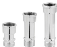
Alongador 1/2 - 3/4 4, 6 e 8cm