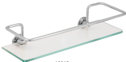
16018 Porta Shampoo Reto