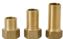
Aumento 1/2 4, 6 e 8cm