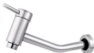
3020 Torneira Parede Slin - 1/4 de Volta