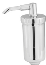
1158 Copo/Filtro ABS