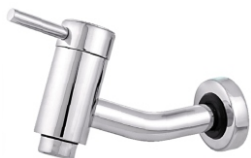
3010 Torneira Parede Slin - 1/4 de Volta