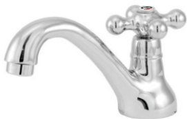
1091 Torneira p/ Lavatório Luxo