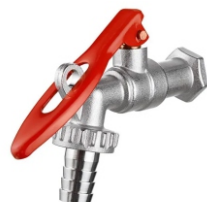
1101 Torneira Esfera Jardim Cadeado 1/2 - 3/4