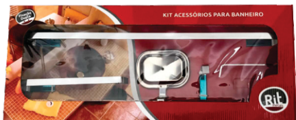
Kit Banheiro 05 peças - Square