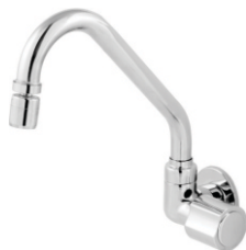
2064 Torneira Bica Móvel Parede Luxo