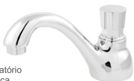
1095 Torneira p/ Lavatório Cisne Automática