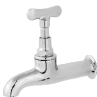
1126 Torneira Cromada p/ Tanque 1/2 - 3/4