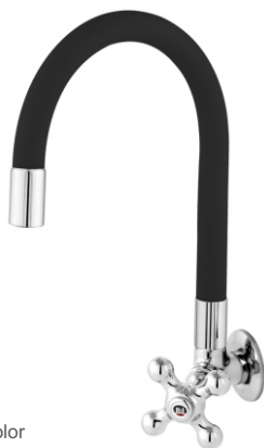
1167 Torneira Color Bica Móvel Parede 1/4 de Volta