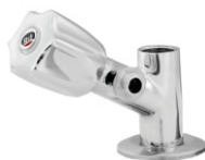
1148 Adaptador 1/2 ou 3/4