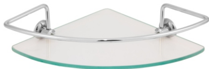
16017 Porta Shampoo Canto