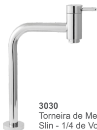
3030 Torneira de Mesa Slin - 1/4 de Volta