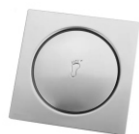
Ralo Click 10 x 10cm