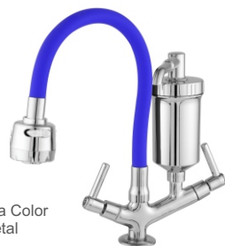
2168 Torneira Gourmet Bica Móvel de Mesa Color c/ Filtro ABS ou Metal