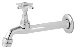
1158 Torneira p/ Pia Cozinha c/ Arejador 1/2 - 3/4 - 18cm