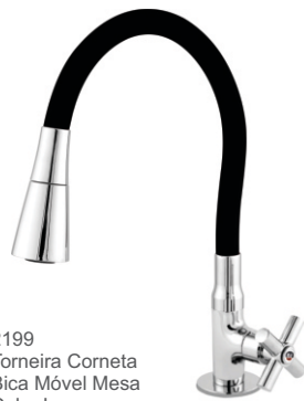
2199 Torneira Corneta Bica Móvel Mesa Color Luxo