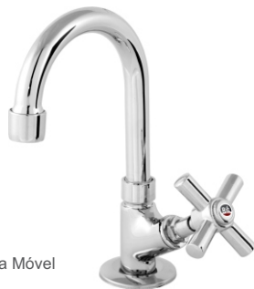
1198 Torneira Bica Móvel p/ Lavatório