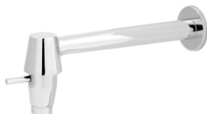
2160 Torneira Cozinha Cabinho Tipo Cree 1/2 - 3/4 - 22cm