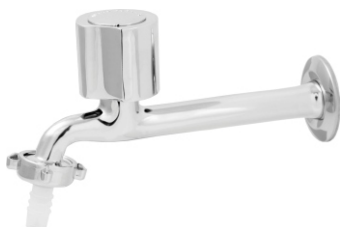
1158 Torneira p/ Pia Cozinha c/ Bico 1/2 - 3/4 - 18cm