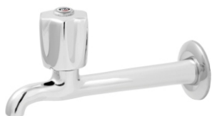
1158 Torneira p/ Pia Cozinha 1/2 - 3/4 - 18cm