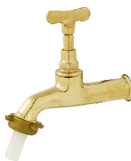
1130 Torneira Amarela p/ Jardim c/ Bico 1/2 - 3/4