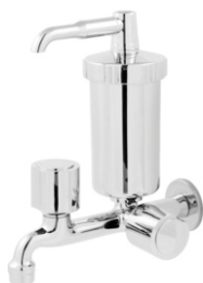
2158 Torneira Fixa de Parede c/ Filtro ABS ou Metal 1/2 ou 3/4