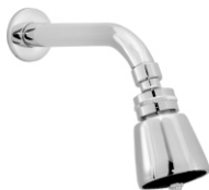
1812 Chuveiro Articulado Metal