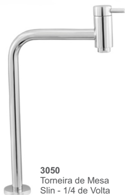
3050 Torneira de Mesa Slin - 1/4 de Volta