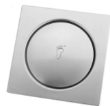
Ralo Click 15 x 15cm