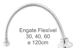
Engate Flexível 30, 40, 60 e 120cm