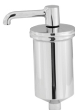
1159 Copo/Filtro Metal