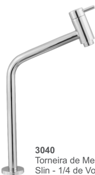
3040 Torneira de Mesa Slin - 1/4 de Volta