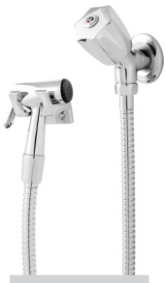
1712 Ducha Higiênica c/ Gatilho Metal