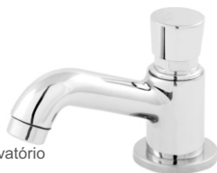
1193 Torneira p/ Lavatório Automática