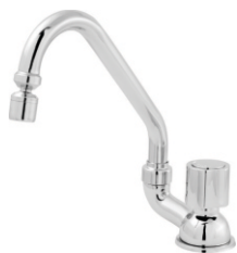
2062 Torneira Bica Móvel Mesa Luxo