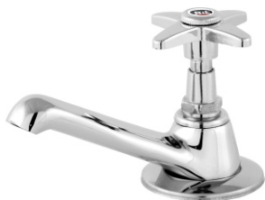
1193 Torneira p/ Lavatório