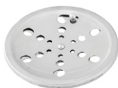
1730 Grelha Redonda 15 x 15cm