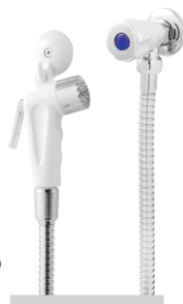
1713 Ducha Higiênica Soft Cromada - Gatilho Branco ou Cromado